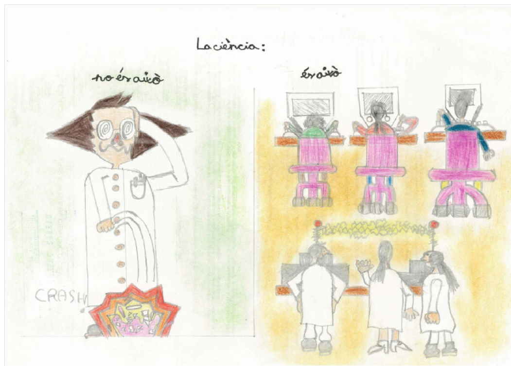
FIGURA 1 Reproducció del dibuix de Marcel Llargués guardonat amb el segon premi, categoria de 6 a 12 anys, en el concurs promogut per l'AGAUR i la Fundació Catalana per a la Recerca l'any 2007 (reproduït amb permís de l'autor).

Es coincideix que la prevalença és baixa, malgrat que la incidència pugui ser regular. Sabem dels casos més espectaculars, generalment en àmbits científics molt «de moda», però desconeixem la seva veritable importància a causa de l'enorme quantitat de publicacions els resultats de les quals mai no es repliquen. El sistema editorial existent —i, més en concret el procediment de revisió d'experts ( peer review )— és incapaç de detectar sistemàticament els casos de frau en els manuscrits que es presenten per ser publicats. Cal distingir entre els errors, que són un problema de qualitat de la recerca, i les trampes, que són un problema d'integritat. Entre aquestes en destaquen principalment la falsificació, la invenció o fabricació de resultats i el plagi, la triada